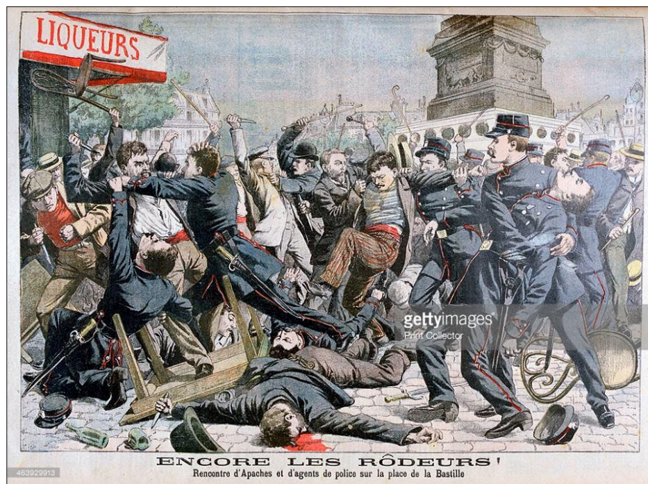
« Encore les rôdeurs ! », Le Petit Journal , 24.08.1904