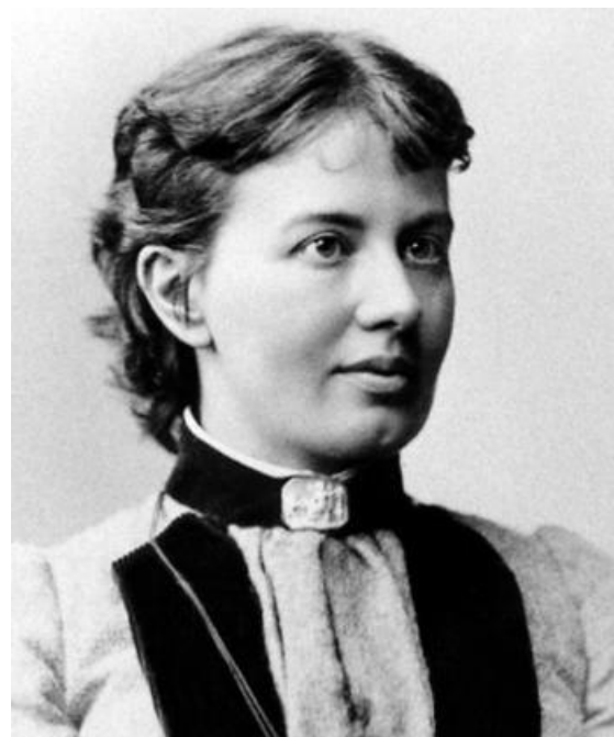
Sofia Kovalevskaja, mathématicienne

Moulin de la Housse – Niveau 0 – 305.4 MAR