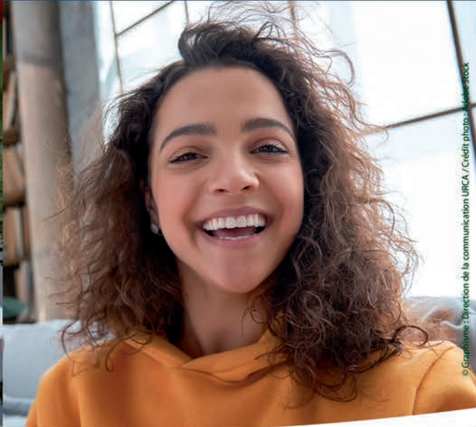
© Graphisme : Direction de la communication URCA