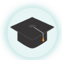
Paiement de la CVEC

La contribution de vie étudiante et de campus (CVEC) est une taxe affectée au Centre régional des œuvres universitaires et scolaires (CROUS) et aux établissements de l'enseignement supérieur publics. Mise en place en 2018, elle vient remplacer la cotisation destinée aux mutuelles étudiantes (réforme de la Sécurité Sociale).