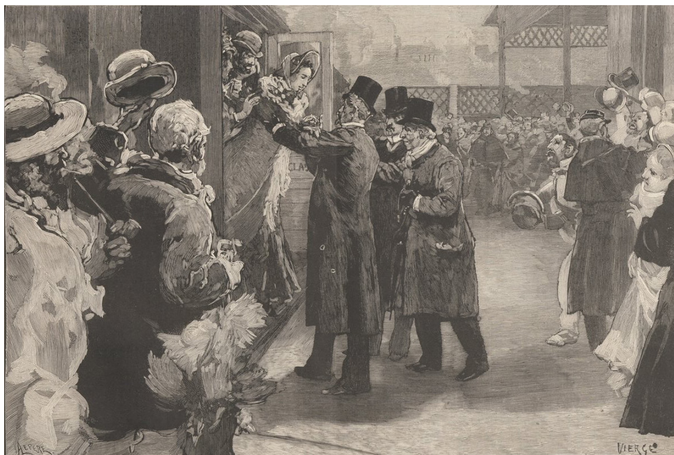
Louise Michel à son arrivée à la gare Saint-Lazare», gravure de Daniel Vierge, Source : Le Monde Illustré, journal hebdomadaire, Paris, 13 septembre 1879, n° 1172, p. 165.