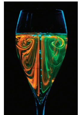
Visualisation d'écoulement (GRESPI)