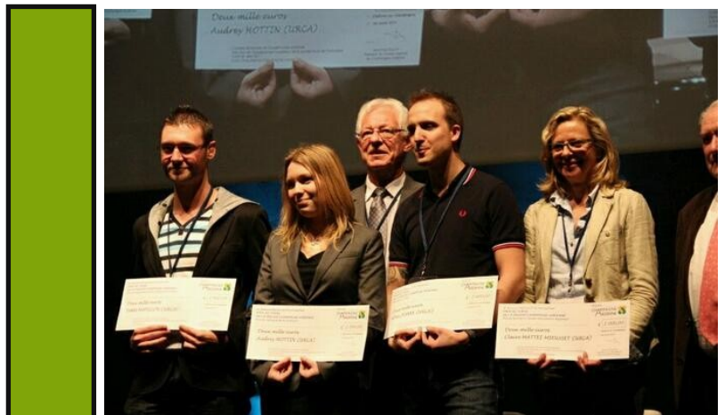
Remise des prix de thèse.

Prix décerné lors des 9ème Assises Recherche Entreprises le 1er avril 2014.