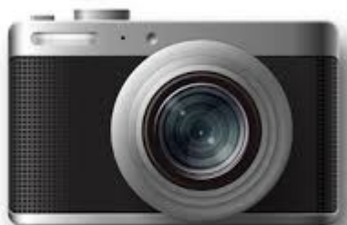
L'appareil photo Qui a ?