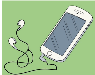
Le smartphone et les écouteurs