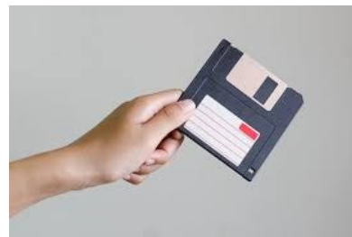
La disquette Qui a ?