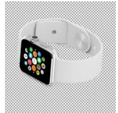
La montre connectée