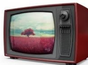
La télévision Qui a ?