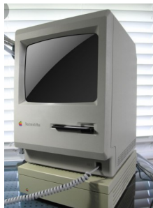
L'ordinateur Qui a ?