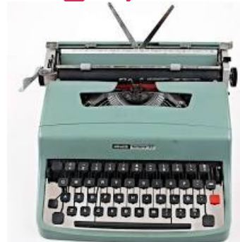
La machine à écrire