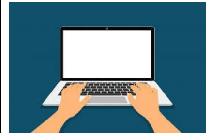
L'écran et le clavier