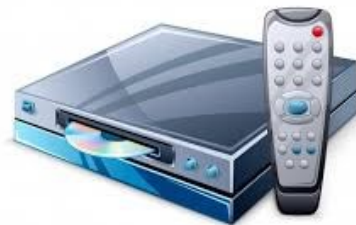
Le lecteur de CD