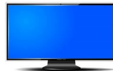
La télévision à écran plat