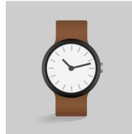
La montre à aiguilles