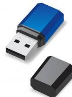
La clé USB